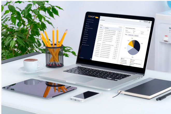
BeSight Now, Manufacturing ERP Solution